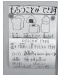
「やさしい日本語」に言い換えるポイントを振り返りながら、実際に避難所に貼るポスターをグループで作りました。