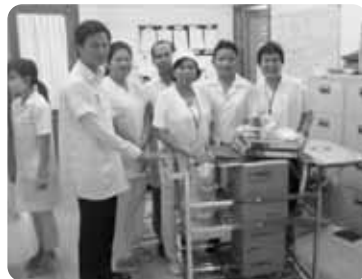
活動への協力者の皆さんとは クメール語で打ち合わせをします