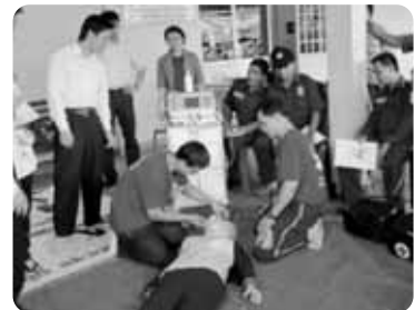
救急医療研修会時の皆さんの 真剣な表情が印象的でした