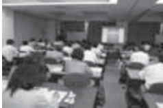
阪神淡路大震災などの事例に基き、災害時になぜ「やさしい日本語」が有効なのか、勉強しました。