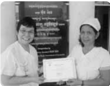
配属先の病院の玄関で ナースの方と

私の仕事は、看護指導者の人材育成です。現地の人たちに健康教育と病気予防の重要性を伝えるため、活動に取り組んでいます。香川県は JICA と共同で国際協力事業を実施しており、県立中央病院の医師と救急認定看護師を講師とする救急医療の講演会がプノンペンの市民病院で実施されました。現地救急隊員が講演に真剣に聞き入り、実技にも積極的に取り組む姿は非常に頼もしく、多くの命が救われていくことを確信しました。一人の力は小さいけれど、自分の培った技術を海外支援に生かせる現実を多くの皆様に知ってもらいたいと今日も院内を巡り、定年後のやりがいのある充実した人生を送っています。皆様が身の回りにある海外支援活動に興味を持っていただけることを願っています。