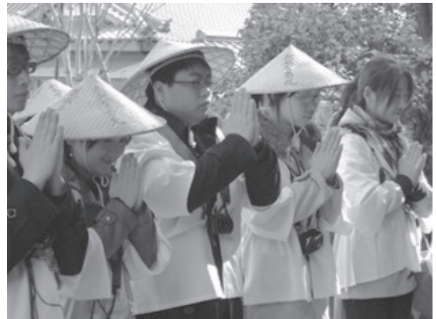
大家，以肃穆的心境参拜！