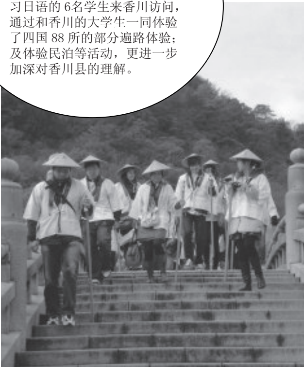
拜访了与香川县和陕西省有着友好缘渊关系的弘法大师空海的诞生地善通市。

作为香川县·陕西省友好交流15周年纪念交流活动的一环，中华人民共和国陕西省正在学习日语的6名学生来香川访问，通过和香川的大学生一同体验了四国88所的部分遍路体验；及体验民泊等活动，更进一步加深对香川县的理解。