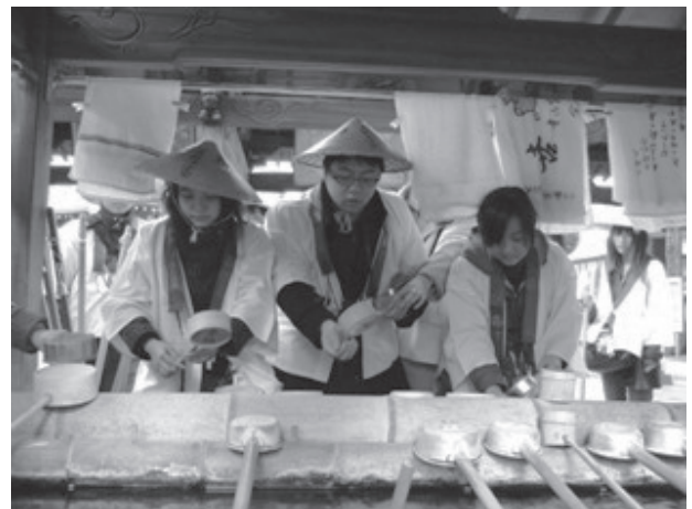
按传授得参拜礼仪，参拜